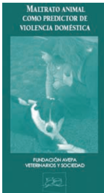
Fig. 3: Las Asociaciones profesionales deben respaldar este tipo de acciones

caso de los animales exóticos promoviendo expolios ecológicos tanto en el origen como en el lugar de destino de esos animales, pero los indicadores que pueden asociarse a una conducta individual humana de riesgo no están determinados, debido a la citada y lamentable generalización de estas prácticas. Aun así ya se documenta la correlación entre la forma de posesión de determinados animales y la perpetración de infracciones legales (23).