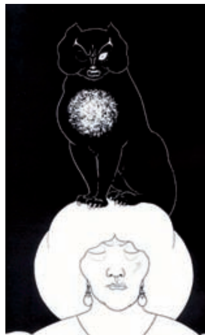
Fig. 1: El gato negro (ilustración de A. Beardsley)