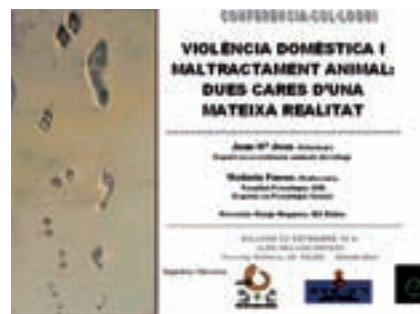
Fig. 2: El abordaje multidisciplinar es necesario en el caso de la violencia doméstica

El maltrato por omisión o desconocimiento es tal vez el que con más frecuencia se observa y debido a ello tiende a pasar desapercibido, pues es más la norma que la excepción. Es frecuente que observemos desde animales educados de una forma incorrecta o que no son manejados de acuerdo a sus necesidades de comportamiento, a la introducción de animales exóticos o la posesión de animales de riesgo. La repercusión social es clara, pudiendo aumentar los casos de agresividad (22) o en el