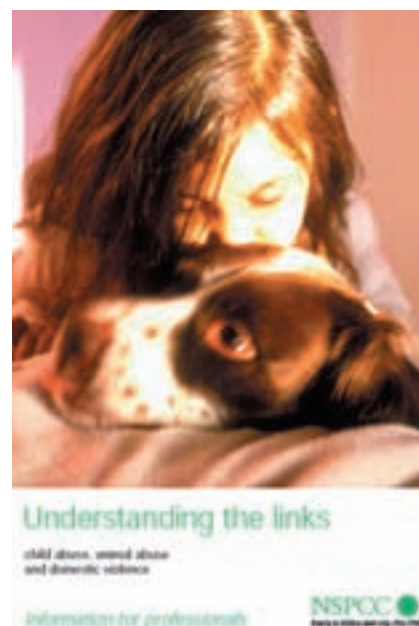
Fig. 4: Los vínculos entre tipos de maltrato deben ser conocidos

Un apoyo apreciable sería el respaldo de las entidades colegiales veterinarias y asociaciones profesionales (Fig. 3), que sirvieran de asesores ante los posibles conflictos que se pudieran plantear y